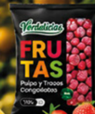
FRUTILLA ENTERA 1KG