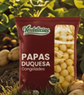
PAPAS DUQUESAS 1KG