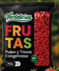
FRUTILLA ENTERA 1KG