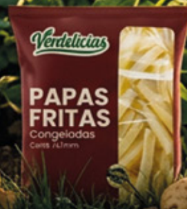
PAPAS FRITAS 14X14MM 2,5KG