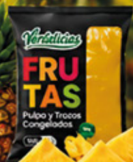
PULPA DE PIÑA 1KG