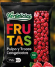
FRAMBUESA ENTERA 1KG