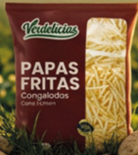
PAPAS FRITAS 7X7MM 2,5KG