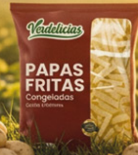
PAPAS FRITAS 12X12MM 2,5KG