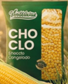
CHOCLO EN GRANO 1KG