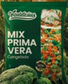
MIX PRIMAVERA 1KG