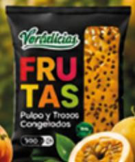
PULPA DE MARACUYÁ (CS) 1KG