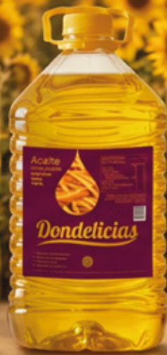
ACEITE DE MARAVILLA 5L