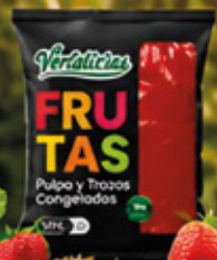
PULPA DE FRUTILLA 1KG