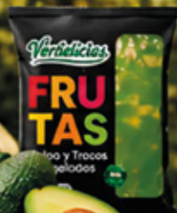
PURÉ DE PALTA 1KG