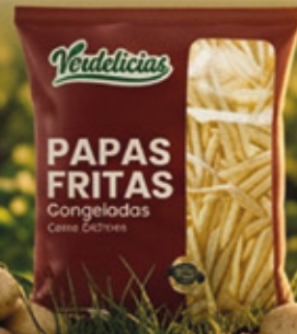
PAPAS FRITAS 10X10MM 2,5KG