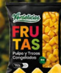
PIÑA EN TROZO 1KG