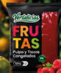
PULPA DE RAMBUESA 1KG