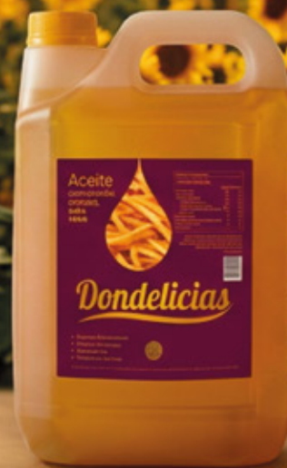
ACEITE DE MARAVILLA 10L