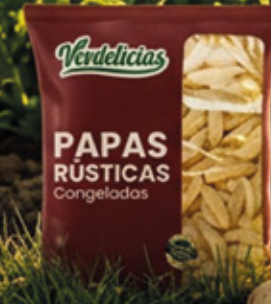
PAPAS RÚSTICAS 2,5KG