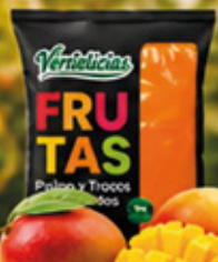
PULPA DE MANGO 1KG