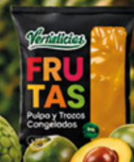
PULPA DE LÚCUMA 1KG