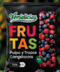
MIX 4 BERRIES 1KG