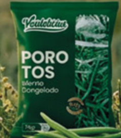
POROTOS VERDES 1KG