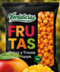
MANGO EN TROZO 1KG