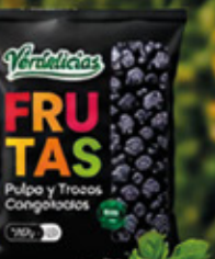
MORA ENTERA 1KG