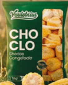
CHOCLO EN TROZO 1KG